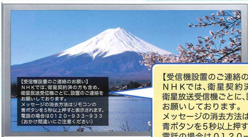
設置確認メッセージ表示例 (NHK BSデジタル放送の画面)

【受信機設置のご連絡のお願い】 NHKでは、衛星契約済の方も含め、衛星放送受信機ごとに、設置のご連絡をお願いしております。 メッセージの消去方法はリモコンの青ボタンを5秒以上押しと表示されます。 電話の場合は0120-933-933 (おかけ間違いにご注意ください)